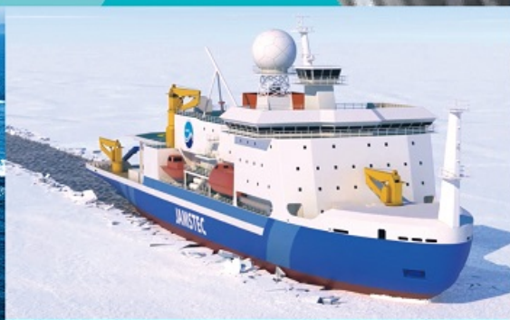
2026年度就航予定の北極域研究船