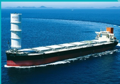
ウインドチャレンジャー (硬翼帆式風力推進装置) 搭載の貨物船「松風丸」

風力エネルギーを利用することで温室効果ガスを抑制する最新の貨物船や、研究者や各種機器を乗せて観測を行う研究船など、様々な船のモデルシップを展示します。