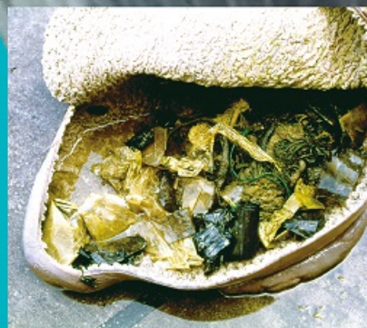
クジラの胃から発見された海洋プラスチック (画像: 国立科学博物館)

2023年1月、大阪湾の淀川河口付近に迷い込んだマッコウクジラ。本展ではこのクジラの歯や胃の内容物を展示します。そこからわかる海の「今」を紹介します。(画像: 国立科学博物館)